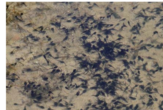
Kijanki ropuchy szarej

Ropuchy szare charakteryzuje się szaro-brązową skórą pokrytą nieregularnymi, ciemniejszymi plamami oraz licznymi brodawkami. Większość swojego życia spędzają one w środowisku lądowym, tylko gody, które mogą rozpocząć się już na przełomie marca i kwietnia, odbywają się w wodzie. Pierwsze do wody wchodzi samce i wabią samice cichym głosem godowym. W populacji jest więcej samców, dlatego też często toczą one między sobą walki o samice. Samice składają od 2500 do 10 000 jaj pod wodą w postaci długich, podwójnych sznurów, które owijają wokół pędów roślin wodnych.