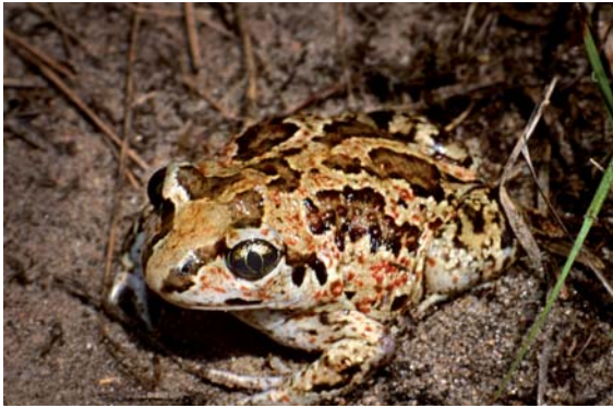
Grzebiuszka ziemna

rozmiary przekraczające 60 mm długości całkowitej. Ciekawostką jest fakt, że pora godowa grzebiuszek jest zwykle związana z nasileniem opadów atmosferycznych i może się powtarzać się kilka razy w roku w okresie kwiecień–lipiec. Jaja składane są do zbiorników wodnych zlokalizowanych na obszarach otwartych. Po okresie rozrodu grzebiuszki opuszczają zbiorniki i prowadzą nocny tryb życia na lądzie. Cechą charakterystyczną tego gatunku jest umiejętność szybkiego zagrzebywania się w ziemi przy pomocy kończyn, na których występują rogowe zgrubienia zwane modelkami piętowymi – stąd też nazwa grzebiuszka. Zgodnie z Rozporządzeniem Ministra Środowiska z dnia 6 października 2014 r. w sprawie ochrony gatunkowej zwierząt objęta jest ścisłą ochroną gatunkową.