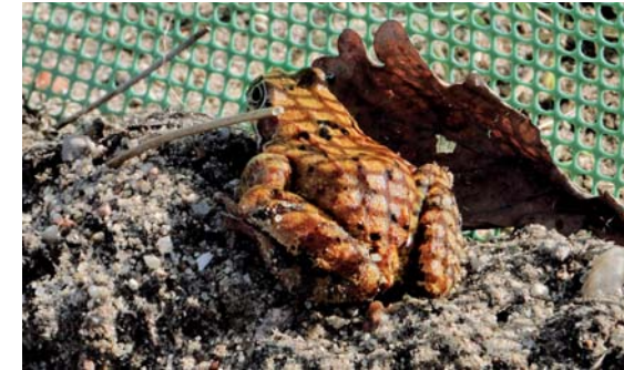
Żaba trawna przy płotku

płazów na obszarze osiedla jest marginalizowany lub pomijany. Na obszarze osiedla Sokółka I została również ustawiona tablica edukacyjna, która przybliży osobom zainteresowanym biologią płazów i przyczyny ich śmiertelności. Podobną tablicę planuje się również ustawić na terenie osiedla VII Dwór w Gdańsku. W celu przybliżenia mieszkańcom Trójmiasta zagrożonego bogactwa gatunkowego płazów na obszarze TPK przygotowywane są również materiały edukacyjne (ulotki, foldery) rozprowadzane wśród mieszkańców osiedli i uczniów szkół.