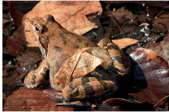
Żaba trawna

Żaba trawna to najwcześniej budzący się ze snu zimowego gatunek żaby, charakteryzujący się dużą zmiennością ubarwienia. Najczęściej mają brązowawy (w różnych odcieniach), pokryty ciemnymi plamkami grzbiet oraz jaśniejszy, żółtawy spód ciała z licznymi, małymi, ciemnymi plamkami. Rozród rozpoczyna się, gdy temperatura wody przekroczy 5°C, a więc często już w marcu. Trwające tylko kilka dni gody odbywają się gromadnie. Samice żab trawnych składają w płytkiej wodzie do 4000 jaj w postaci kłębów, które pływają na powierzchni wody. Rozwój młodych osobników z jaj trwa do trzech miesięcy – w czerwcu i w pierwszej poł-