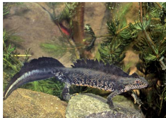
Traszka grzebieniasta

Najcenniejszym gatunkiem z gromady płazów występującym na obszarze Parku jest traszka grzebieniasta, dochodząca do 16–17 centymetrów