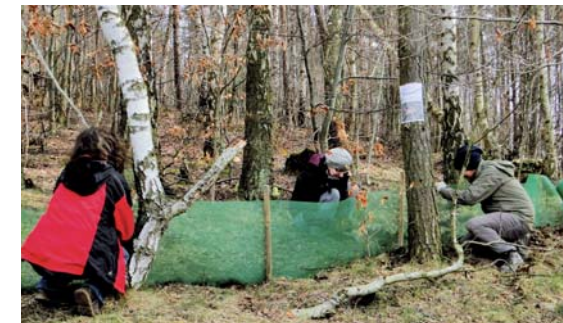
Stawianie płotki chroniącej płazy przed wejściem na drogi osiedlowe