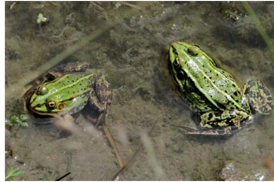
Żaby wodne

Oba gatunki zaliczamy do tak zwanych żab zielonych – w ich ubarwieniu przeważają barwy w odcieniach zieleni. Jak wszystkie żaby zielone są one blisko spokrewnione genetycznie i mogą się ze sobą krzyżować. Są do siebie bardzo podobne morfologicznie. Przez cały rok wykazują ścisły związek z wodą (zbiornikiem, w którym przystępują do rozrodu) i są bardzo wrażliwe na pogorszenie się jej stanu ekologicznego np. wzrost zanieczyszczenia. W Trójmiejskim Parku Krajobrazowym oba gatunki zasiedlają zwykle niewielkie i płytkie zbiorniki wodne. Do rozrodu przystępują od końca kwietnia do czerwca. Zimują na lądzie w bezpośrednim sąsiedztwie zbiornika,