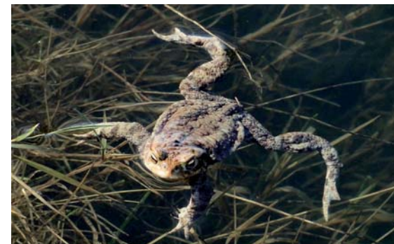
Ropucha szara

Jest to największa krajowa ropucha, charakteryzująca się najwyraźniej zaznaczonym dymorfizmem płciowym (czyli różnicami w wyglądzie osobni-