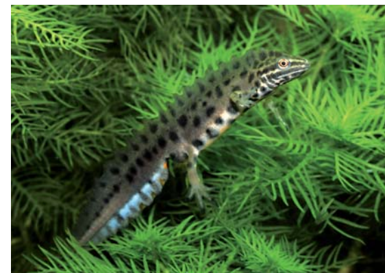
Traszka zwyczajna

Jest to najliczniejszy gatunek traszki w naszym kraju. Jest wyraźnie mniejsza od traszki grzebieniastej – osiąga 10–11 cm długości. Do rozrodu przystępuje w zbiornikach wodnych, które charakteryzują się gorszymi warunkami środowiskowymi niż te, których do rozrodu wymaga traszka grzebieniasta. Traszka zwyczajna może składać jaja w zbiornikach płytkich, okresowo wysychających a nawet w rowach melioracyjnych. Gody w zależności od warunków atmosferycznych mogą