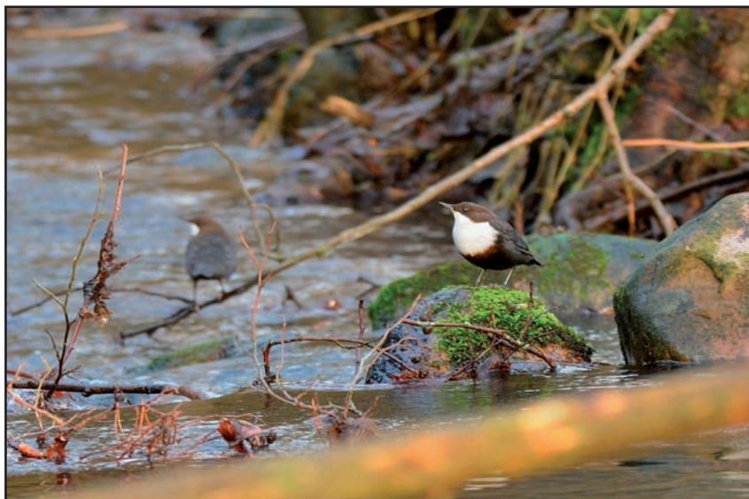
Jednoczesne stwierdzenie dwóch pluszczy na Zagórskiej Strudze