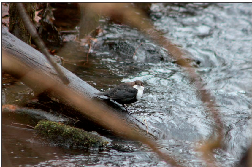
Pluszczyk zimujący na Potoku Oliwskim

Tomiałojć L., Stawarczyk T. 2003. Awi-fauna Polski. Rozmieszczenie, liczebność i zmiany. PTPP „pro Natura”. Wrocław.