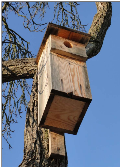
Budka lęgowa z pierścieniem zabezpieczającym otwór wlotowy przed rozdziobaniem przez dzięcioła oraz utrudniającym penetrację budki przez czworonożne drapieżniki.

Pracownicy Trójmiejskiego Parku Krajobrazowego corocznie wieszają i konserwują budki lęgowe dla różnych gatunków ptaków. W 2014 roku skontrolowali, wyczyścili lub naprawili 46 budek lęgowych rozwieszonych w poprzednich latach na