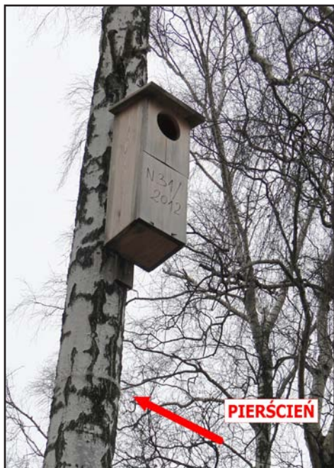
Budka lęgowa dla puszczyka ze specjalnym zabezpieczeniem (pierścień z kolcami) uniemożliwiającymi dotarcie do budki czworonożnym drapieżnikom.

gowego oraz spędza w budkach mroźne noce. Wróble i mazurki budują również tak zwane gniazda zimowe, na które trzeba uważać podczas czyszczenia budek. Wnętrze takiego gniazda wyłożone jest grubą warstwą z piór innych ptaków. Gniazdo pozwala parze ptaków zaoszczędzić nawet 40% energii, co często ma decydujące znaczenie dla przeżycia zimą! Zniszczenie takiego gniazda może być dla ptaków śmiertelne. Budki czyścimy poza okresem lęgowym ptaków od 16-go października do końca lutego, uważajmy jednak przy tym na wspomniane wyżej zimowe gniazda wróbli i mazurków.