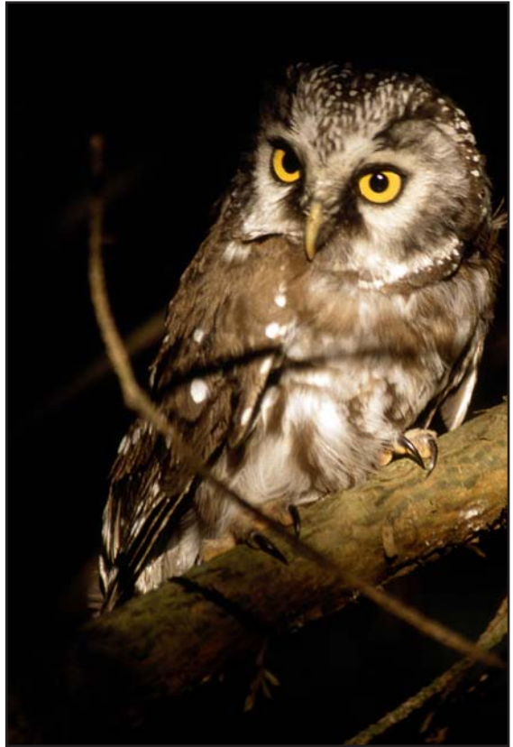
Włochatka – gatunek sówy chętnie wykorzystujący specjalne budki lęgowe.

Ptacom gniazdującym w budkach lęgowych grożą drapieżniki, takie jak kuna leśna i domowa, gronostaj i łasica, kot, sroka i kawka, dzięcioł duży. Aby zminimalizować zagrożenie ze strony drapieżników, powinny być one wykonane z materiałów dobrej jakości (litego drewna), a w ich ścianach bocznych nie powinno być szczelin, które mogą zostać rozkute przez dzięcioły. Powinny być również wyposażone w specjalny pierścień osadzony na otworze wlotowym, który uniemożliwia penetrację przez drapieżniki. Budki nie mogą mieć posiadać patyczka przy otworze wlo-