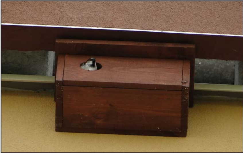
Budka lęgowa na fasadzie budynku zasiedlona przez wróble.

obszarze Parku. Wśród budek znajdujących się na obszarze Parku znajdowały się budki różnego typu, w tym: budki A1 (dawniej S1) – dla drobnych dziuplaków, budki B (dawniej S2) – dla dziuplaków o nieco większych rozmiarach ciała, budki D – dla gągołów, siniaków, puszczyków i włochoatek oraz specjalne budki dla pliszek. Zasiedlonych zostało 25 budek lęgowych. W 3 budkach gniazdowały gągoły, w 3 – siniaki; w trzech lęgi odbyły pliszki górskie, w 11 – sikory (bogatki lub modraszki) i w jednej gniazdował kowalik. Cztery budki były wykorzystywane jako miejsc nocowania przez dzięcioły duże.