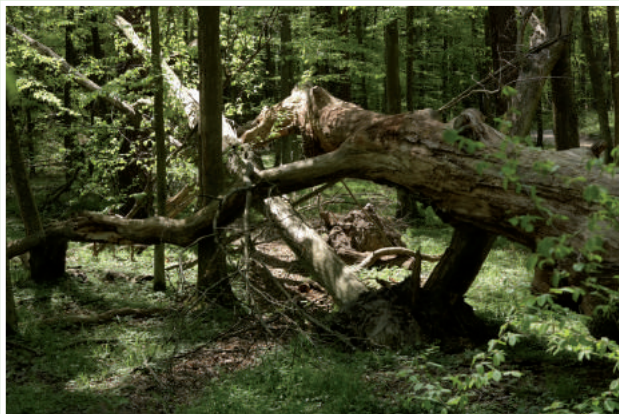
Drzewa martwe, ale nadal pomniki przyrody

Przy rozwidleniu dróg zwraca uwagę martwy dąb szypułkowy (PP nr 199). Kończy on pomnikową aleję, na którą składa się w sumie 11 drzew w wieku od 150 do 300 lat. Część z nich została powalona przez wiatr, jednak nadal pełnią one funkcje pomników przyrody. Nieopodal rośnie okazały grab. Na jego korze znajdziemy kolejny z pospolitych porostów krajowych – otwornicę gorzką – o szaro-białym zabarwieniu i charakterystycznym, gorzkim smaku. Wśród roślin runa wyróżnia się jaskier rozłogowy. Kilkadziesiąt metrów dalej możemy zapoznać się z kilkoma gatunkami drzew iglastych: sosną zwyczajną, świerkiem pospolitym oraz daglezią zieloną. Daglezia jest gatunkiem obcym we florze krajowej (pochodzi aż z Ameryki Północnej) i została tu sprowadzona przez człowieka. Obecność świerka jest również wynikiem ludzkiej działalności, ponieważ jego naturalny zasięg w Polsce nie obejmuje tego regionu.