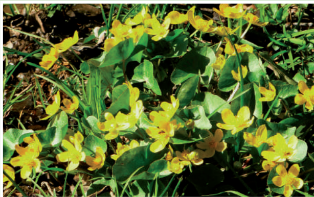
Kwitnąca knieć błotna (zwana kaczeńcem)

W celu zachowania walorów przyrodniczych Doliny Samborowo, Trójmiejski Park Krajobrazowy od kilku lat prowadzi na jej obszarze zabiegi ochrony czynnej, polegające na regularnym koszeniu łąk (w odstępach dwuletnich). Działanie to ma na celu powstrzymanie procesu zarastania ich przez las.