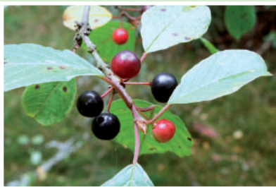
Owoce kruszyny pospolitej

koralewy kwitnący już wczesną wiosną ma kwiaty żółtawe, zaś owoce przybierają piękną koralowoczerwoną barwę. Zobaczymy tutaj również leszczynę oraz leczniczą, kruszynę pospolitą. Poboczne ścieżki porastają gęste zarośla jeżyn i młode drzewa z gatunku klon jawor. Od połowy lipca pojawiają się owocniki grzybów