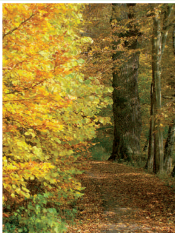
Pomnik przyrody „Gruby Dąb”

„Gruby Dąb”, czyli dąb szypułkowy o obwodzie 5,60 m i wysokości 25 m to pomnik przyrody nr 206 A. Dno doliny pomiędzy łąką a leśną drogą zajmuje las dębowo-grabowy, tzw. grąd. Tak żyzne siedlisko sprzyja wielu gatunkom ptaków. Jednym z nich jest strzyżyk – bardzo mały, o donośnym głosie. Przedstawicielami roślin zielnych są: przytulia wonna, gajowiec żółty, gwiazdnica wielkokwiatowa, szczawik zajęczy, konwalijka dwulistna oraz dzwonek brzoskwiolistny. Uwagę zwraca licznie występujący barwinek pospolity. W pobliżu rosną różne gatunki drzew: buk pospolity, dąb szypułkowy, grab pospolity, jesion wyniosły, lipa drobnolistna, klon pospolity i jawor, topola osika, olsza czarna oraz brzoza brodawkowata. Przy odchodzącej w bok drodze znajdują się charakterystyczne zagłębienia w zboczu, o średnicy kilkunastu metrów. Są to dawne wyrobiska żwirowni, gdzie możemy zobaczyć szereg gatunków ciepłolubnych.