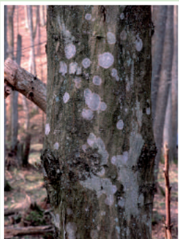
Porosty na pniu graba